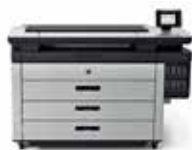
HP PageWide XL 8000 Drucker

Der schnellste Großformatdrucker aller Zeiten – für Schwarzweiß und Farbe 1