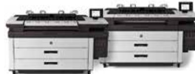
HP PageWide XL 4500/4000 Drucker

Leistungsstarke, effiziente Systeme für den Schwarzweiß- und Farbdruk