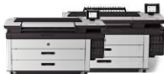
HP PageWide XL 5000 Drucker

Der schnellste Großformatdrucker aller Zeiten – für Schwarzweiß und Farbe 1